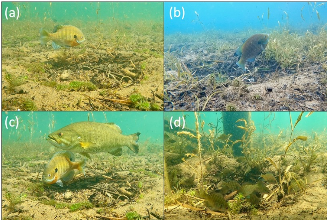
図1 ブルーギルのオスの巣保護行動と卵捕食者：(a) 巣の周囲の旋回、(b) 尾で水流を送る行動、(c) 卵捕食者（コクチバス）から巣を防衛する行動、(d) 小型ブルーギルによる卵捕食。