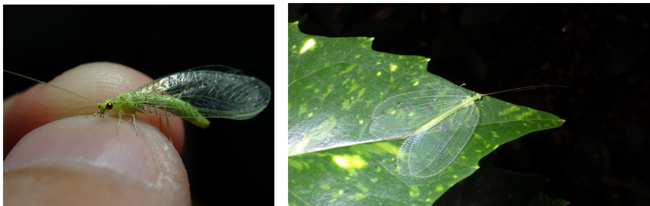
図1 本研究で採集したクサカゲロウ科の昆虫(左:セボシクサカゲロウ、右:アミメクサカゲロウ)