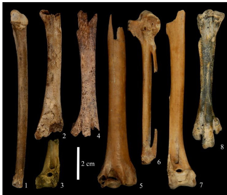
図 1. 田螺山遺跡で確認されたガン類の幼鳥（1-4）と在地性の成鳥（5-8）の骨