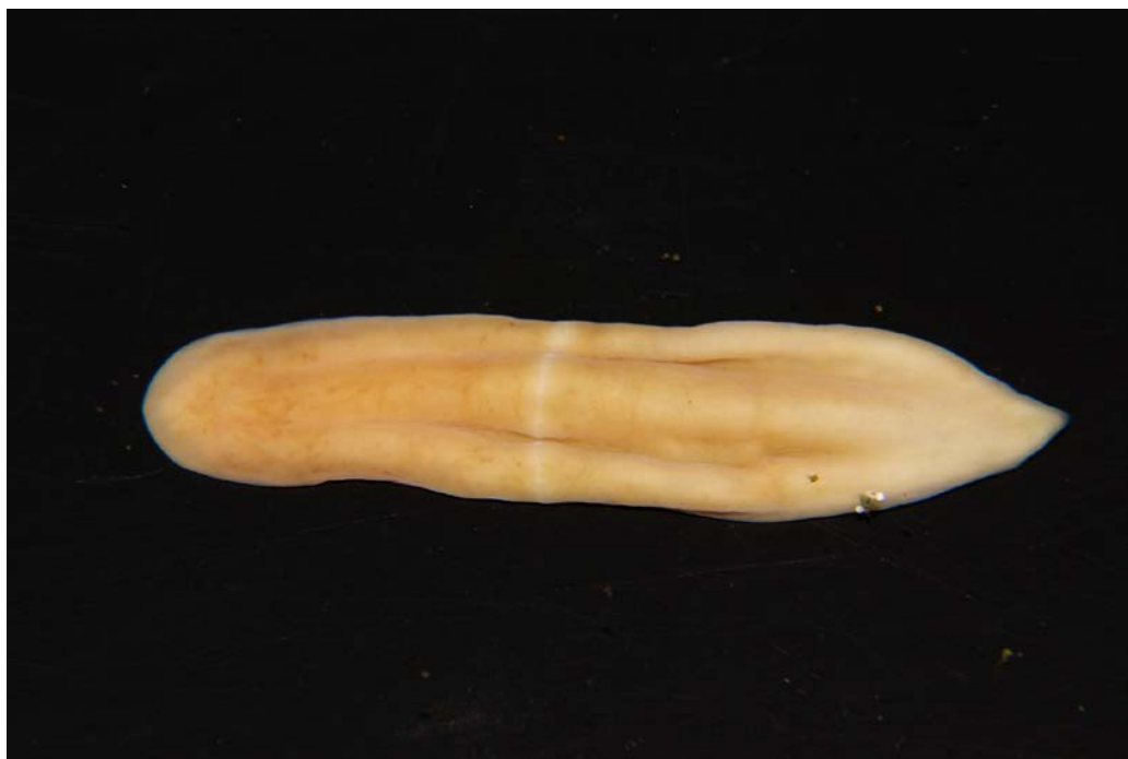
図 1：三浦半島沖で採取された珍渦虫 Xenoturbella japonica 。体長は 5 cm 程度である。写真の左側が前方であり、右側が後方。中央をベルト状に横断する線があるのが珍渦虫の特徴。