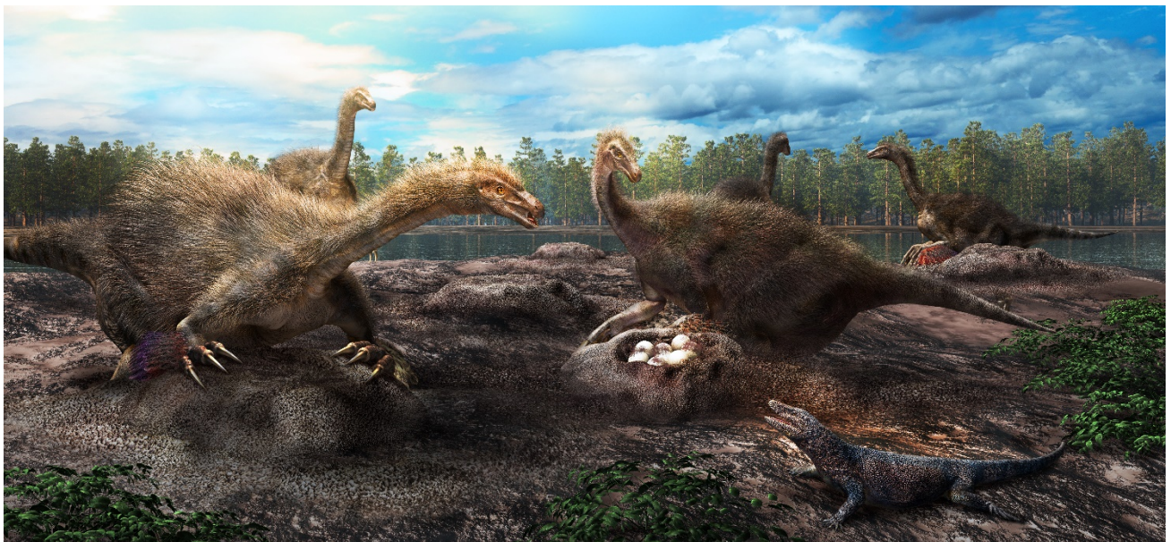
図3. テリジノサウルス類恐竜の集団営巣の復元図。復元画提供：服部雅人氏。