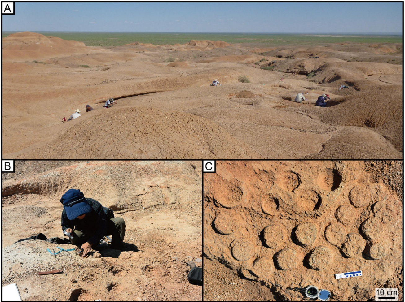
図 1. (A) モンゴル ゴビ砂漠東部のテリジノサウルス類集団営巣跡発見場所。人がいる地点で巣化石が確認されています。(B) 発掘の様子。(C) 巣化石の例。丸い卵化石が並んでいることが分かります。