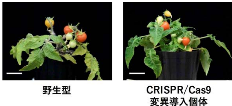
図1. 高効率CRISPR/Cas9導入トマト 高効率CRISPR/Cas9によって得られた S/IAA9 ノックアウトトマト(右).

高効率CRISPR/Cas9によって作製された S/IAA9 ノックアウトは、種子を形成せずに結実した単為結果性の果実や、既に報告されている葉の形態異常も生じており(図1、2)、変異導入を行った当世代で得られた花粉や果実、次世代の種子においても高い効率で変異が生じていました。さらに、CRISPR/Cas9を導入した植物体の次世代個体を解析した結果、葉の形態異常などの形質とともに、DNA上の変異が伝搬されていることが明らかになりました。以上、本研究より高効率CRISPR/Cas9を用いたゲノム編集によって、単為結果性を示す S/IAA9 ノックアウトトマトの作出が可能となりました。