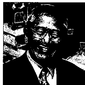
米パデュー大学 根岸 英一特別教授 (帝人グループ名誉フェロー) 帝人久村奨学生第5回生(1957年)

そして自らの「夢」を見つけたら真理を突き詰めるまで、とことんチャレンジしてください。今後の皆さんの大いなる活躍に期待しています。