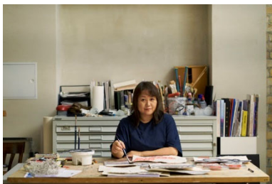
Chiharu Shiota Berlin, 2020

1955 年東京都生まれ。東京芸術大学美術学部絵画科卒業後、1991 年よりベネッセアートサイト直島のアートプロジェクトに関わる。2004 年より地中美術館館長、ベネッセアートサイト直島・アーティストティック ディレクターを兼務。2007 年～2017 年 3 月まで金沢 21 世紀美術館館長。「金沢アートプラットフォーム 2008」、「金沢・世界工芸トリエンナーレ」、「工芸未来派」、「井上有一展」等を開催。2013 年 4 月～2017 年 3 月まで秋田公立美術大学客員教授。2013 年 4 月～2015 年 3 月まで東京藝術大学客員教授。2015 年 4 月～2021 年 3 月まで東京藝術大学大学美術館館長・教授。主な著書に、『アート思考 ビジネスと芸術で人々を幸福を高める方法』『直島誕生 過疎化する島で目撃した「現代アートの挑戦」全記録』ほか。