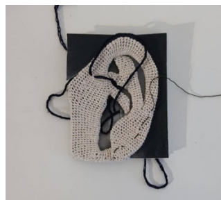
51 回生 上野 里紗