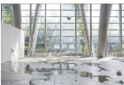
50 回生 増田 麻耶