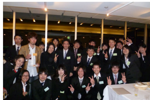
奨学生証授与式・懇親会