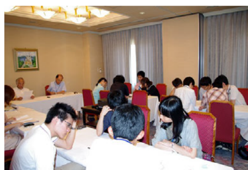
奨学生夏季研修旅行