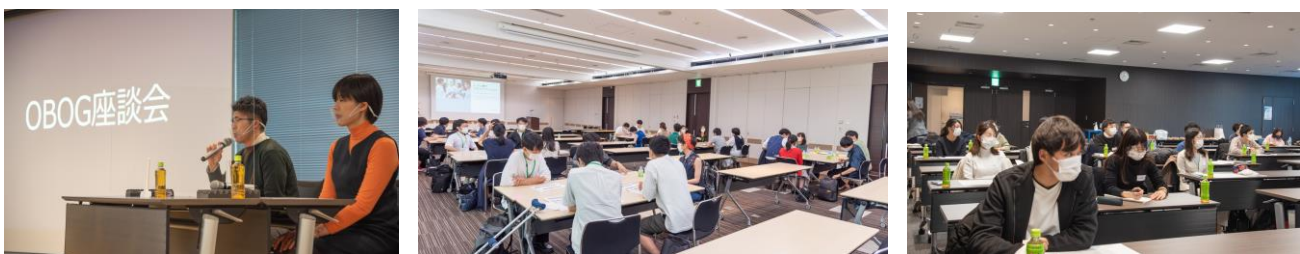
OBOGが来て、初期研修・後期研修の様子などを話したり、奨学生同士の交流もあります