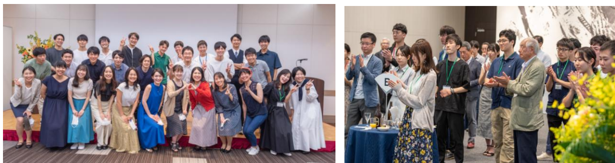
授与式、交流会の様子