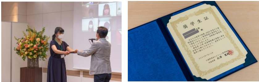
(左) 毎年7月に行う新奨学生発表会での奨学生授与の様子、(右) 全奨学生に渡される奨学生証

※交流会に参加する際の往復交通費、ならびに遠方の方の宿泊費については、ピジョン奨学財団が全額負担します。 ※交流会への出席は必須ではありません。