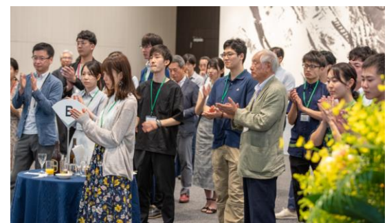
授与式、交流会の様子