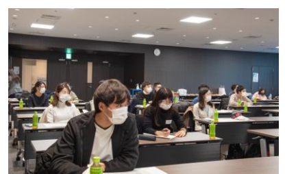
OBOGが来て、初期研修・後期研修の様子などを話したり、奨学生同士の交流もあります