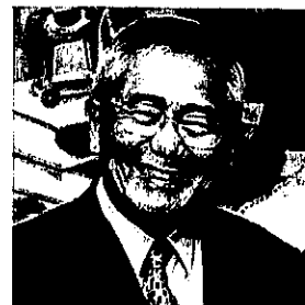
米パデュー大学 根岸 英一特別教授 （帝人グループ名誉フェロー） 帝人久村奨学生第5回生（1957年）

そして自らの「夢」を見つけたら真理を突き詰めるまで、とことんチャレンジしてください。今後の皆さんの大いなる活躍に期待しています。