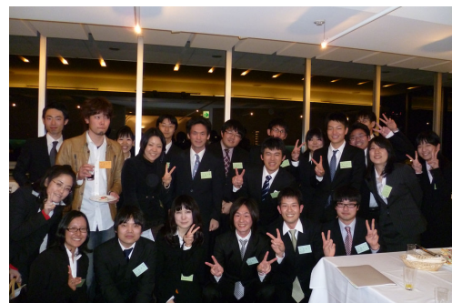
奨学生証授与式・懇親会