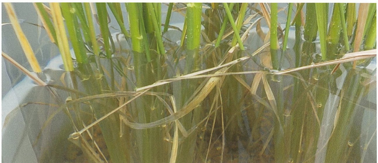
(図 11) 上段左：準備した 90L のバケツ 上段右：90L のバケツにバケツ稲を沈めた様子 下段：水没した葉耳