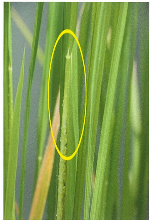
(図8) 8月10日 葉耳がなくても成長している