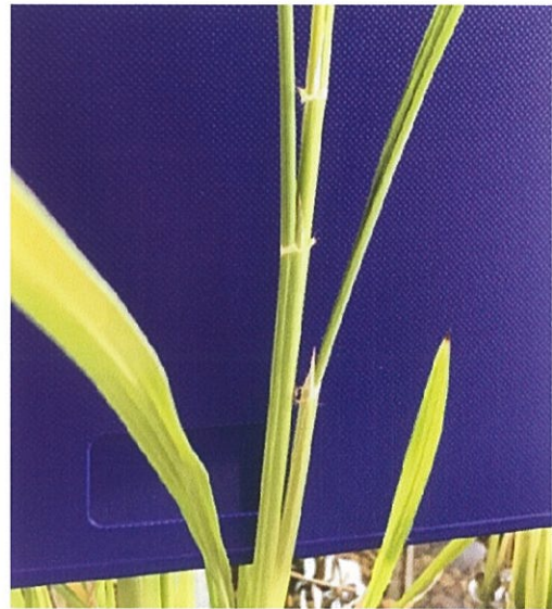
(図 3) 左：バケツ稲のイネに直接染色液を付着させた様子 右：翌日になっても染色されていなかった