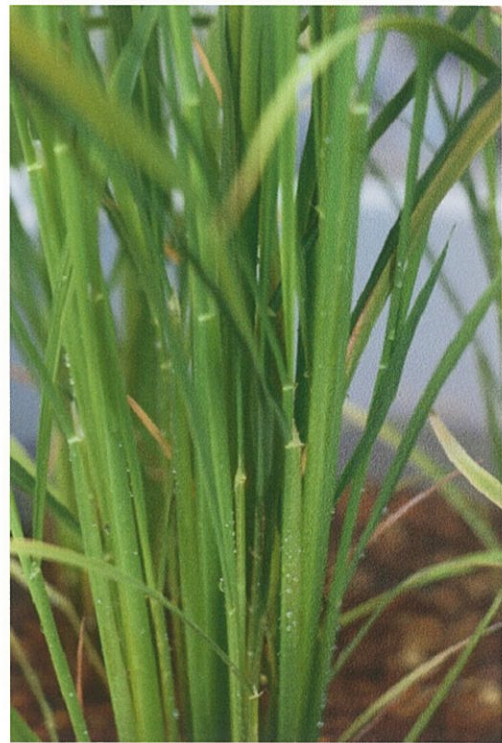
(図5) 左：6月21日 葉耳を取る前 右：7月2日 葉耳を取って11日目