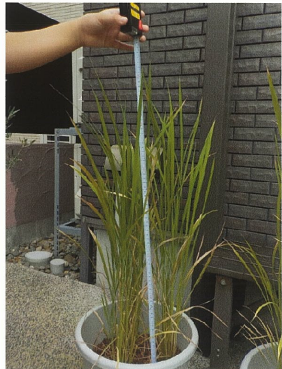
(図7) 7月18日 左 : 6月21日に葉耳を除去したイネ (高さ72cm) 右 : 葉耳を除去せず栽培しているイネ (高さ73cm)