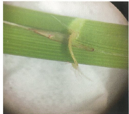
(図 4) 実体顕微鏡で観察 左：一部を切り取ったイネの葉耳に染色液を付着させた様子 右：約 1 時間後、染色液を軽くふき取って観察した様子