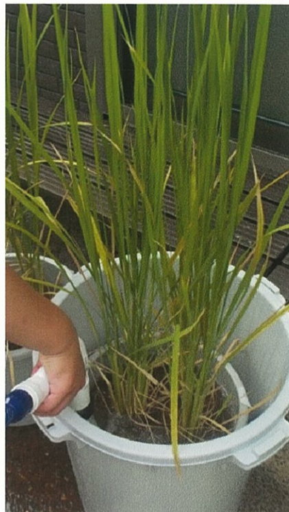
（図9）45Lのバケツに水没（45Lのバケツに15Lのバケツ稲をバケツごと入れました。）

② 8月10日 下から2個目までの葉耳のみ水に浸っている状態ですが、45Lのバケツだけイネの背丈が明らかに高くなっています（図10）。