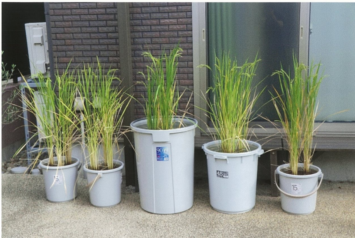
(図12) 水没させたイネは背が高く、茎や葉の色が濃い