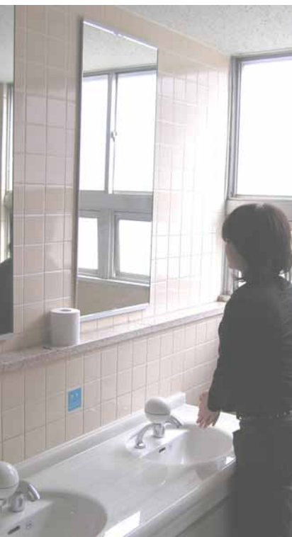
鏡が大きくなった第一学群A棟2階の女子トイレ

「臭くて、汚い」とのイメージを持たれている、学内のトイレを一新しようと、トイレのリニューアルが進められている。第一学群A棟2、3階のトイレ4室、第二学群A棟のトイレ17室が改修された。農林技術センターのトイレ5室(男子2室、女子3室)も工事が完了しており、医学系学系棟のトイレ6室(男女各3室)は現在、工事中だ。