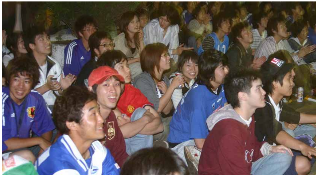
体芸食堂前で400人応援 サッカーW杯の日本対豪戦を観戦しようとして「世界的蹴球文化論I」を履修する学生らが6月12日、体芸食堂前に特設スクリーンを設置した。同日、約400人の学生、豪からの留学生らが共に代表の試合を観戦した。(3面にW杯特集記事)

昨年度の本学生の就職率の集計が5月1日、まとまった。就職率は88%だった。一昨年度の89%を1%下回る程度では横ばいの結果となった。就職課では、今回の結果を進路報告者が少なかつたため、実質的な就職率は伸びていると分析している。 昨年度の学群卒者の就職率は希望者843人のうち741人。学群卒者の業種別就職率は企業が81.6%、公務員が11.5%、教員が6.9%だった。 大学院修了者のうち、大学教員などの研究職を除いた就職者は、修士課程1105人のうち488人、博士課程308人のうち76人だった。 地域別では、就職者のうちの67%が都内へ就職した。つくば市内や茨城県内への就職者は51.6%程度にとどまった。 昨年のTX開通は学生の就職活動にも好影響を与えた。これまでは泊まりがけ