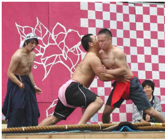
「THE 国技」で戦う学生(平砂駐車場メインステージで)

今年のとどろき祭では、「国技2006春場所」の3「フラインディング・やど」の企画が行われ、会場「やど」の運動会「THE」を盛り上げた。