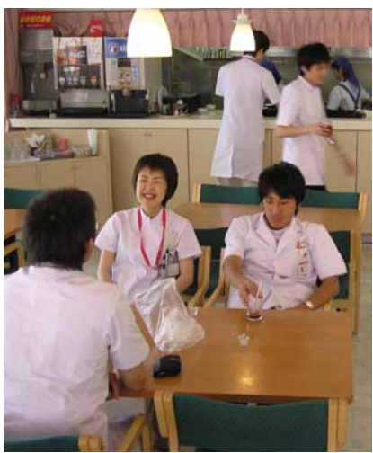
白衣を着た学生でにぎわう医学喫茶