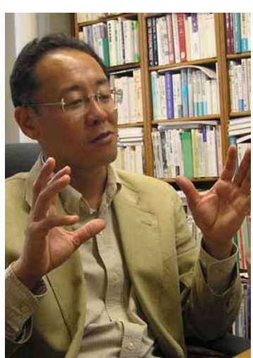
清水論助教は、サッカーバブルとよばれる中で、サポーターたちのブームが、地域差やクラブの歴史と特徴の違いにより、チームごとに異なる。清水論助教は、サッカーバブルとよばれる中で、サポーターたちのブームが、地域差やクラブの歴史と特徴の違いにより、チームごとに異なる。