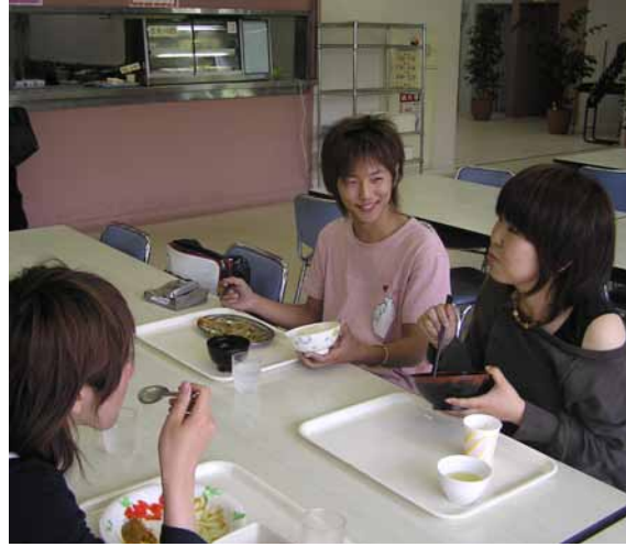
1階で夕食を楽しむ芸専の学生

堂経営の改善に努めてきた。選定に関わった硬式野球部だ。「食堂が学生に身近な存在になった。その話を見が反映できる食堂」とするのは吉池サービズの後任 考へ、柔軟な対応が期待されている。