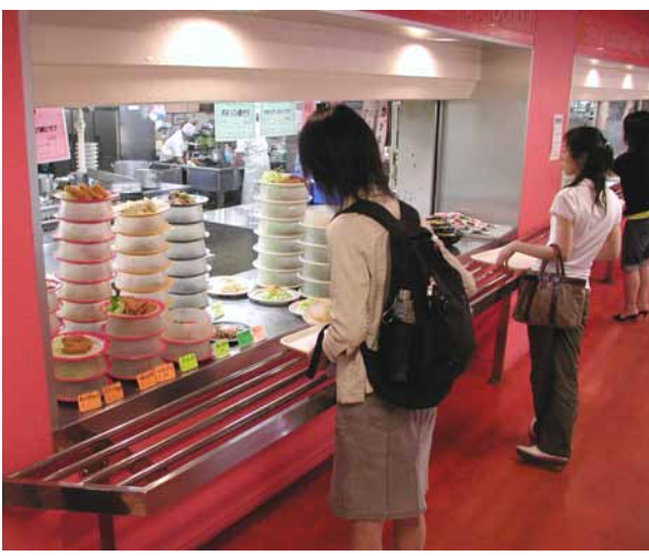
自分の好きなおかずをトレーにのせていく

チキンカツや串カツなど、1は冷たい飲み物8種類とボリューミー満点だ。体專、温かい飲み物4種類を選べる。医学喫茶で日替わりA定食を注文した男子学生(医学)