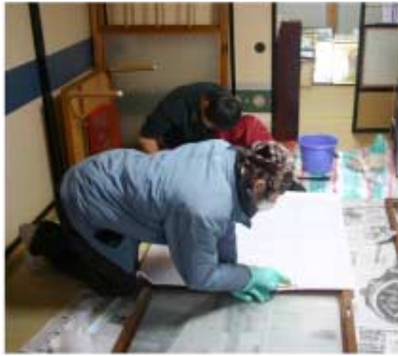
被害にあった家屋で障子張りを手伝う