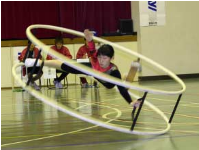
第10回全日本ラート競技選手権大会が11月6、7の両日、静岡県沼津市の東海大学体育館で開催され、森、深瀬 個人総合で優勝

12月17日午後6時半から、1D204 20日午後6時から、図情205講義室 21日午後6時から、大会館国際会議室