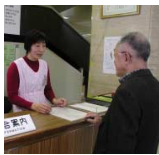
不慣れた外来患者にも心強い味方

食事の介助に携わる。家が遠く、なかなか母親が来て見ることができない。移動、花や植木の水やり、話し込むことも多い。男性や学生のボランティアが少ないのが悩み。早朝や夜間に参加できる人を求めているという。