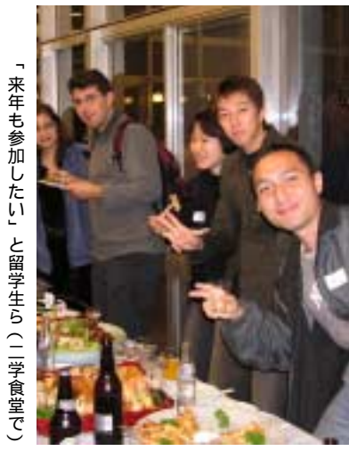
「来年も参加したい」と留学生ら(二学食堂で)

日本では、障害者向けの特典は増えてきたといっても、用意された席はホールの端に追いやられている。つくばの、あるコンサートホールでは障害者席は2階にある。確かに舞台は見えるが、離れた位置からでは、楽器の微妙な光沢や奏者の息遣いまでは伝わってこない。