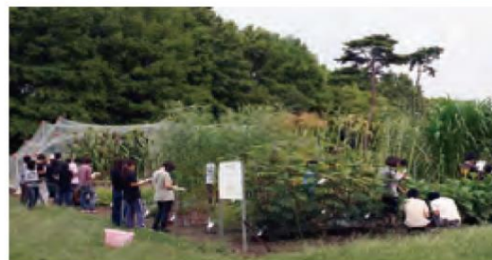
雑穀、工芸作物などの作物見本園