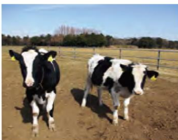
乳牛のほか、ヒツジ、ニワトリなどを飼育