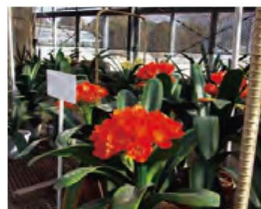
筑波大学で育成したクシシラン品種