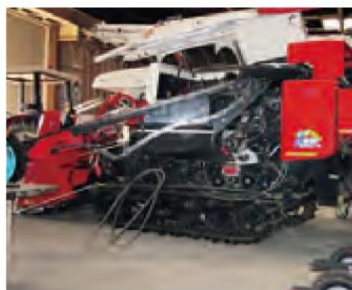
大型機械や中小型機械