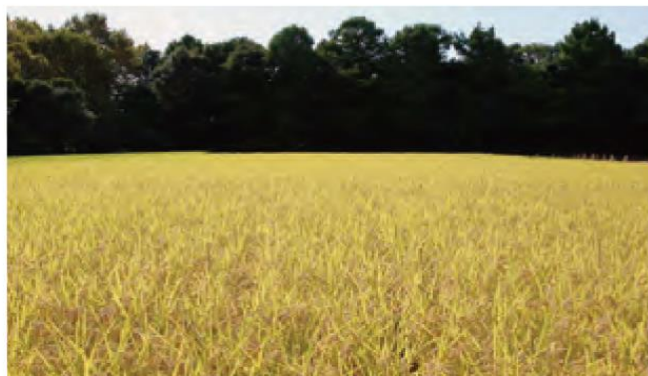
水田では特別栽培米を生産