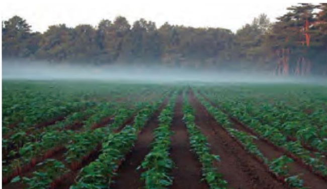
朝霧漂うソバ圃場